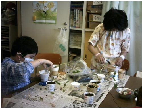
理科…(5年生)発芽の実験と観察