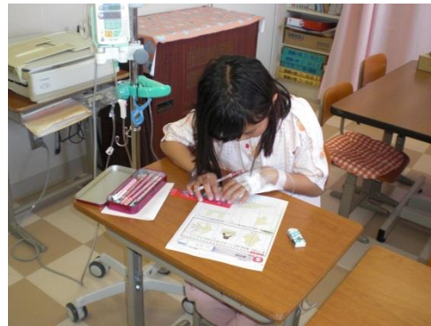
算数…(6年生)線対称、点対称