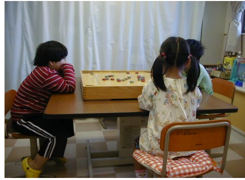
学級活動…みんなで楽しくゲーム大会