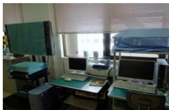
インターネットで調べ学習もできるよ