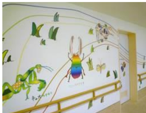
楽しいイラストのある廊下

教室は小児病棟(5A)の奥にあり、学級担任が毎日異学年の複数の児童を同時に指導しています。個別指導を中心にし、教科によっては全体指導もします。休み時間を確保するとともに、医療との連携を重視し、体調や治療に合わせて授業を進めるようにしています。