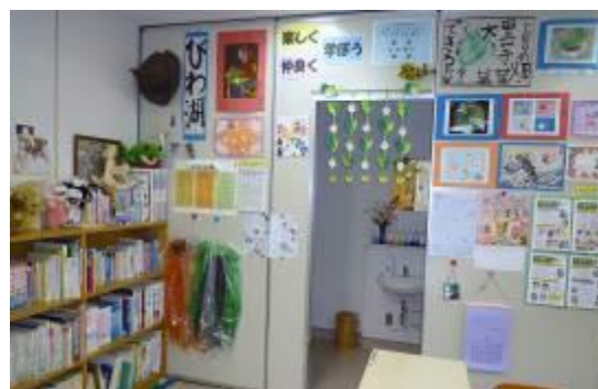
図書の貸し出しもしています