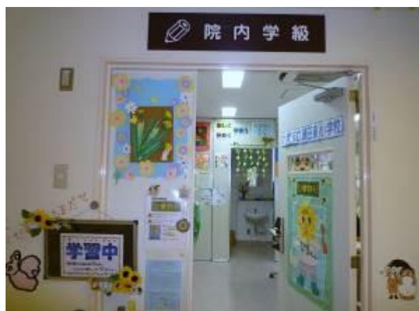
院内学級「ひまわり」教室の入口