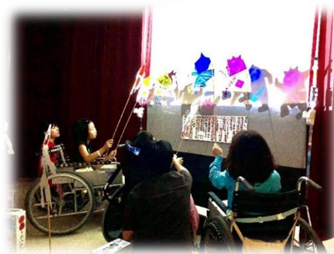
文化祭 小学部影絵劇 「じごくのそうべえ」

小学生と中学生と一緒に学んでいる環境を活かして、学部・学年を超えた取組(運動会、文化祭、学習交流会等)を行う中で、自主性、社会性、仲間と協働する力を育むよう努めています。