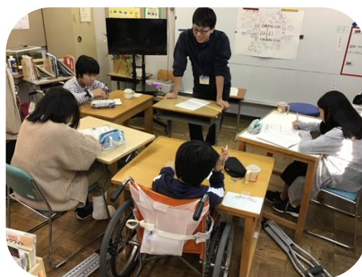
中学部自立活動「ストレスについて」

個々の安静度や体調に応じて、教材・教具や学習形態を工夫しています。文部科学省の GIGA スクール構想に伴う ICT 環境整備も完了し、病弱特別支援学校における児童生徒の自主的な学習活動にも取り組んでいけるよう、インターネット等通信ネットワークの活用や、タブレット等の情報機器活用研究を推進しています。