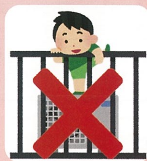
子どもの事故防止