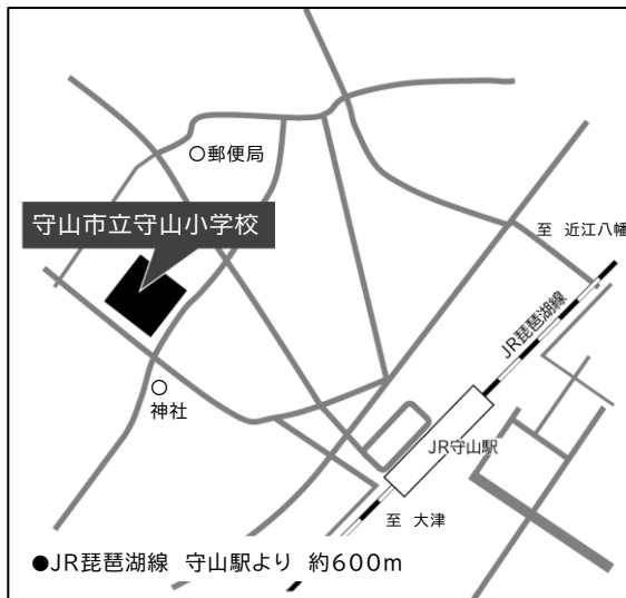
[守山市立守山小学校]