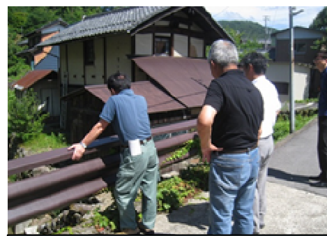
平成30年6月 簡易量水標設置協議