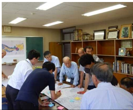
平成28年8月 水害履歴調査