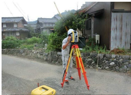
平成29年12月 既存住宅調査