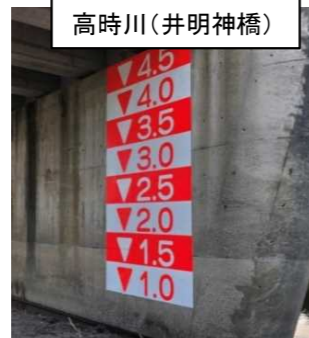
平成30年 簡易量水標設置