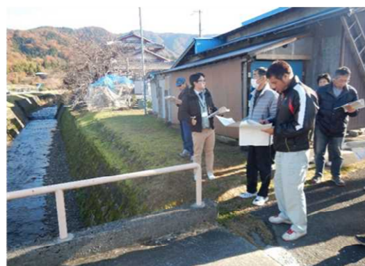
平成29年12月 まちあるき