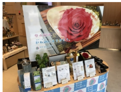
マザーレイクにありがとう実行委員会の母の日催事