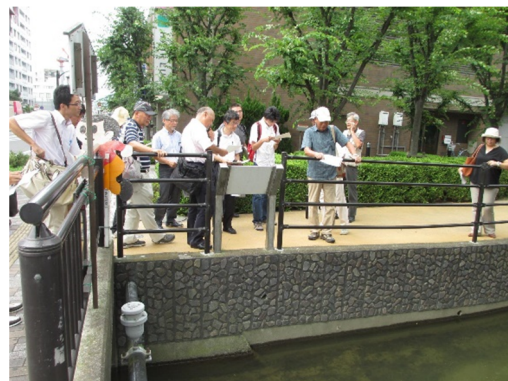
地域連携ワーキングで開催した現地視察