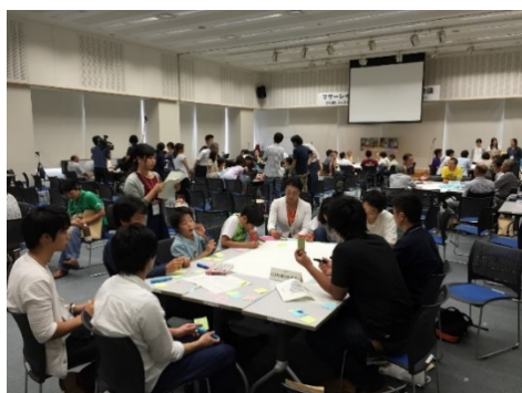
多様なテーマによるグループ討論

活動に賛同するいくつかの事業者から定期的に寄付をいただけるようになったことを踏まえ、寄付金を用いた市民主導による活動展開も試みられました。平成30年度（2018年度）に立ち上がった「マザーレイクにありがとう実行委員会（母の日・父の日・びわ湖の日プロジェクト）」は、琵琶湖や水源の森に配慮したギフトのプロデュースを通じて、琵琶湖の保全につながる経済活動を促すとともに、普段の生活の中でびわ湖を思い、行動につなげていく人の輪が広がることを目指しています。また令和元年度（2019年度）に立ち上がった「琵琶湖アローズ (BIWAKO ARROWS)」は、市民らの自発的な活動展開を創出する方法を検討しています。