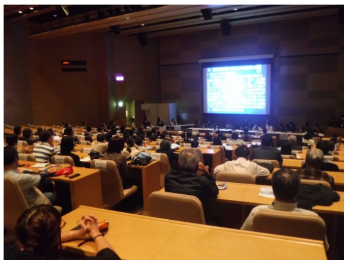
第 17 回世界湖沼会議の様子（茨城県）