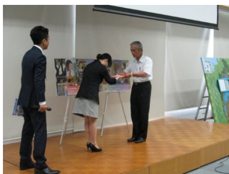
事業者からの寄付金の受領式