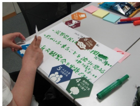
話し合った結果をキーセンテンスにまとめる