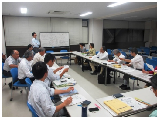
運営委員会における話し合い

した事例はありましたが、マザーレイクフォーラムと有機的に連携し、地域と全域での意見交換を活発化することはできませんでした。