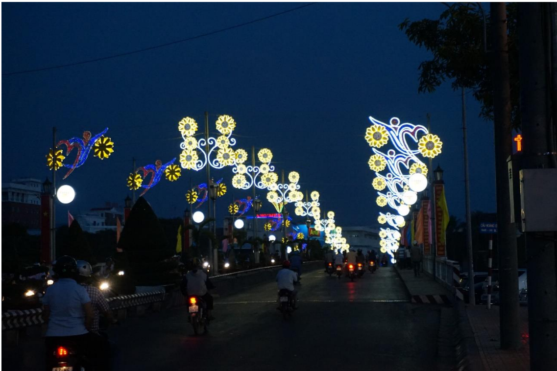
「旧正月は街も華やかにライトアップされます」