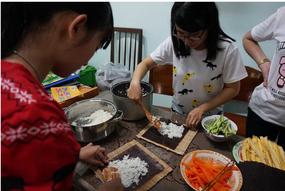
日本語を勉強している人たちとの交流会で、巻き寿司を作りました