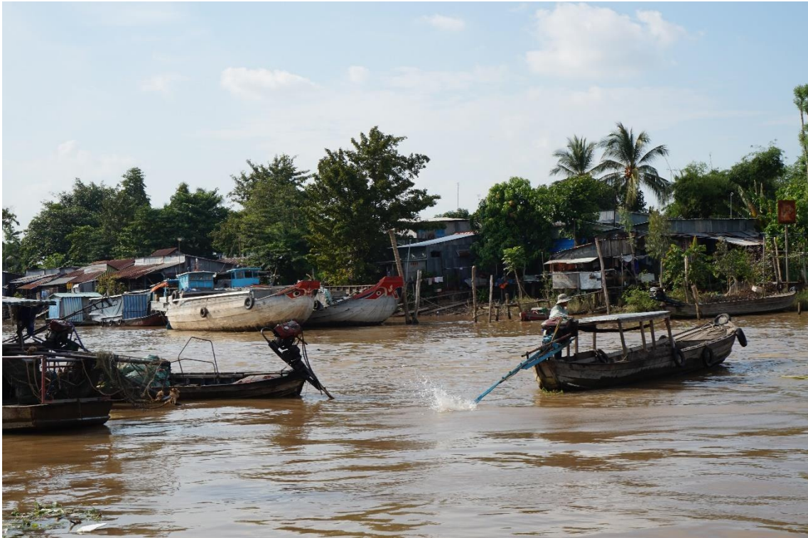
橋がないところは船で渡ります。 朝は水上マーケットにもなります（メコン川・ロンスエン市場の前）