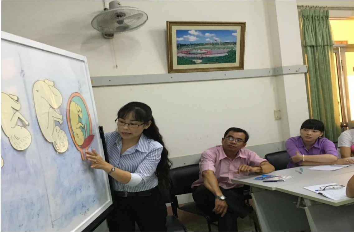
「リプロダクティブヘルスセンターで教材を使いながら意見交換」