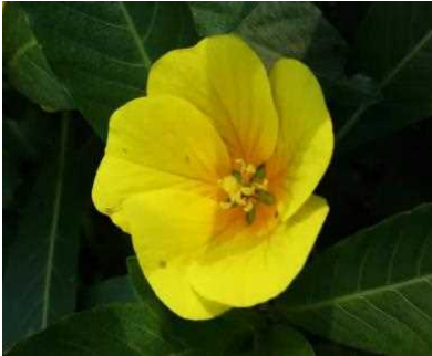
オオバナミズキンバイ

「オオバナミズキンバイ」と「ナガエツルノゲイトウ」は、どちらも琵琶湖や内湖、河川などの水ぎわに生育する水陸両生の多年生の植物で、外来生物法の特定外来生物に指定されています。繁殖力が非常に旺盛で、春から秋にかけて成長して面積を拡大していきます。また、分散能力も高く、漂着した葉や茎の断片からでも根を生やし、その場所で成長していきます。