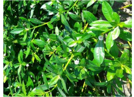
ナガエツルノゲイトウ

これらの植物は、岸沿いの水面を広い範囲でおおってしまうことがあり、船舶の航行障害や漁具への絡み付きといった被害が発生していることに加え、水質や水産資源への悪影響、水田への拡大、湖畔の植生への影響、河川を通じた下流域への流出などが心配されています。このことから、県や関係市、NPO 団体や漁協などで構成する琵琶湖外来水生植物対策協議会により、これらの侵略的外来水生植物への対策を推進しています。