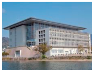
琵琶湖環境科学研究センター

令和2年度からは、第六期中期計画に基づき、「琵琶湖をとりまく環境の保全再生と自然の恵みの活用」「環境リスク低減による安全・安心の確保」、「気候変動に適応した豊かさを実感できる持続可能な社会の構築」に向けて試験研究を推進しています。