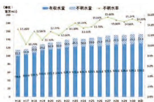
図1 琵琶湖流域下水道の不明水量の推移

不明水とは、処理場に来れてくる下水量のうち、下水道料金等で把握することが困難なものことです。不明水は、主に雨天時浸入水と地下水等からなり、この内雨天時浸入水については、雨どいから汚水ますへの誤接続や、汚水管の接続部の隙間等から流入するものです。下水道施設の老朽化等により不明水量は増加の傾向にあります。本県の年間の不明水率は、現状15%程度（図1）ですが、豪雨時に下水量が急激に増大することにより、マンホールからの溢水や下水道施設の冠水等を引き起こし、公衆衛生の悪化や下水道の施設被害が発生するという問題が起こっています。