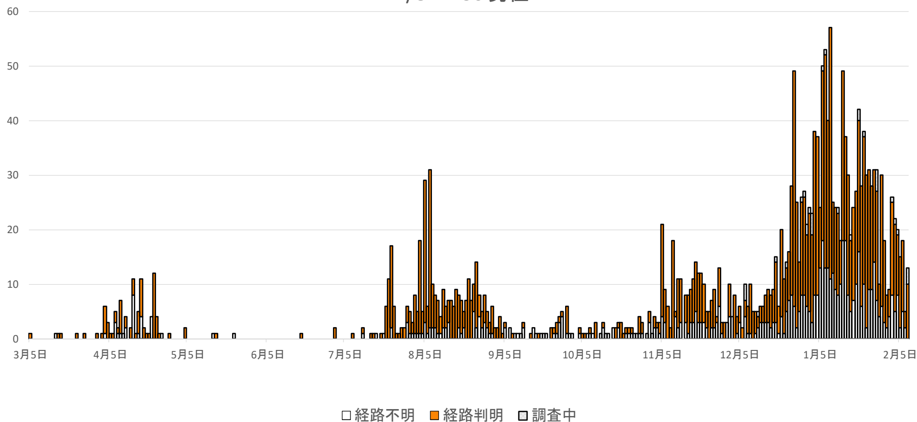
新型コロナウイルス感染の流行曲線(公表日別) 2/8 17:30現在