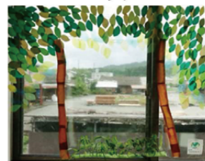
flowerpatrol30 うい・T さん