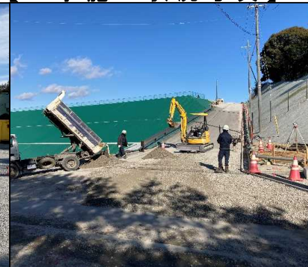
③ キャッピング工 進入路部で舗装路盤工を行っています。