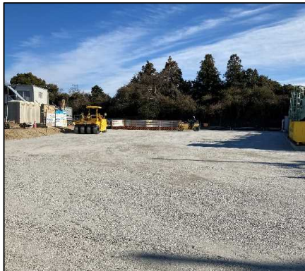
③ キャッピング工 水処理施設前で舗装路盤工を行っています。