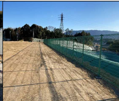
⑤ その他工 天端平面部にフェンスを設置しました。