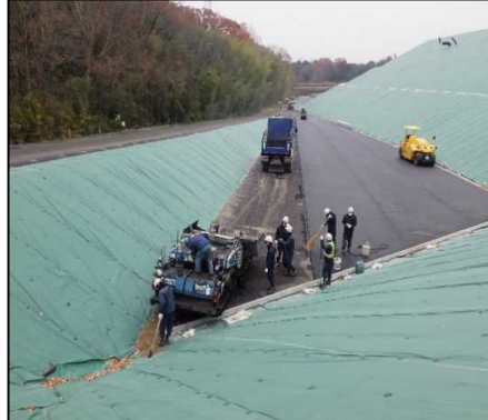
③ キャッピング工 E工区でアスファルト舗装を行っています。