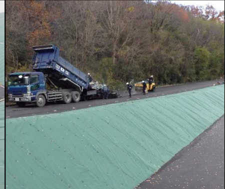
③ キャッピング工 西市道でアスファルト舗装を行っています。