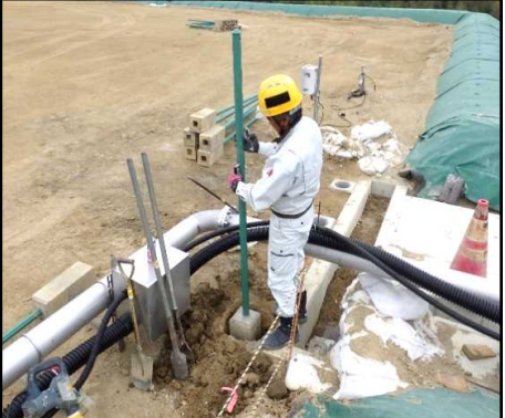
⑤ その他工 フェンスの基礎を設置しています。