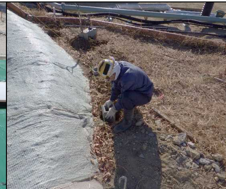
⑤ その他工 フェンスの基礎を設置しています。