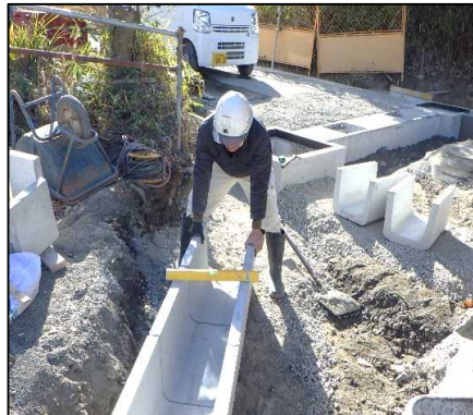
① 工事用進入路 U字溝を設置しています。