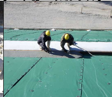
④ 雨水排水工 小段排水張りコン打設を行っています。