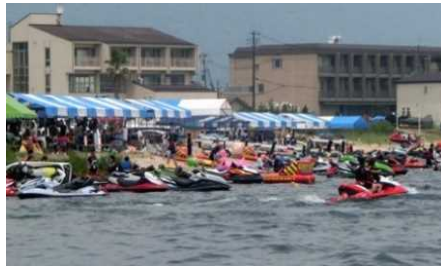
近江舞子・北比良(大津市)