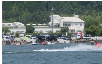
矢倉川河口スロープ(彦根市)

全体として、苦情件数は条例制定当初と比較して大きく減少しているものの、矢倉川河口スロープや白鬚神社のように地域によって異なる課題が見られるようになってきており、地域ごとの事情を考慮し、関係者と連携しながら対応していくことが必要となっています。