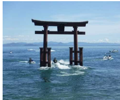
白鬚神社湖中大鳥居(高島市)