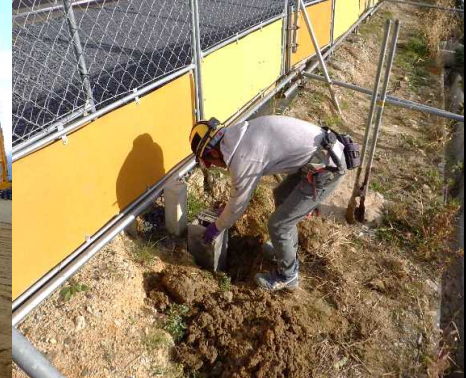
⑤ その他工 フェンス基礎の設置を行っています。