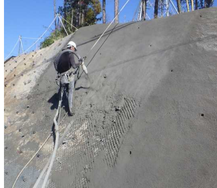
① 工事用進入路 法面部モルタル吹付を行っています。