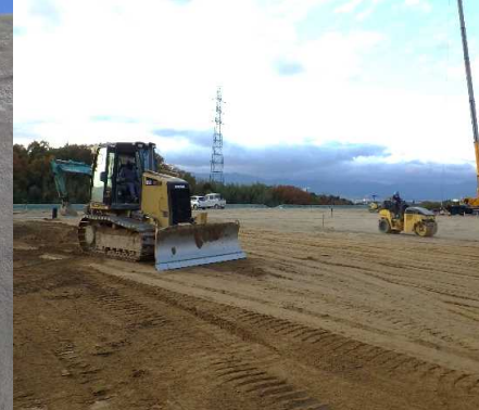
③ キャッピング工 水平部の盛土を行っています。