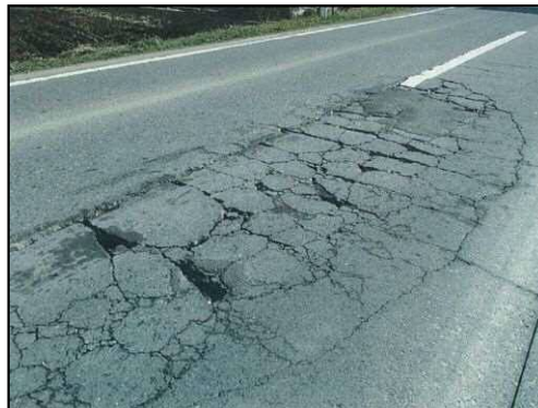
たかぎようかいち うりゅうづ しばはら ●高木八日市線【東近江市瓜生津-芝原】