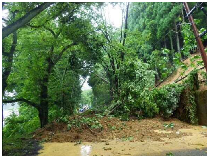
平成30年7月 被災状況