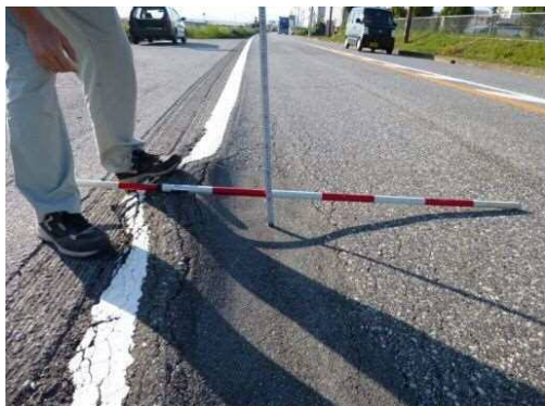
ひがしこうざか ●国道365号【長浜市 東上坂】