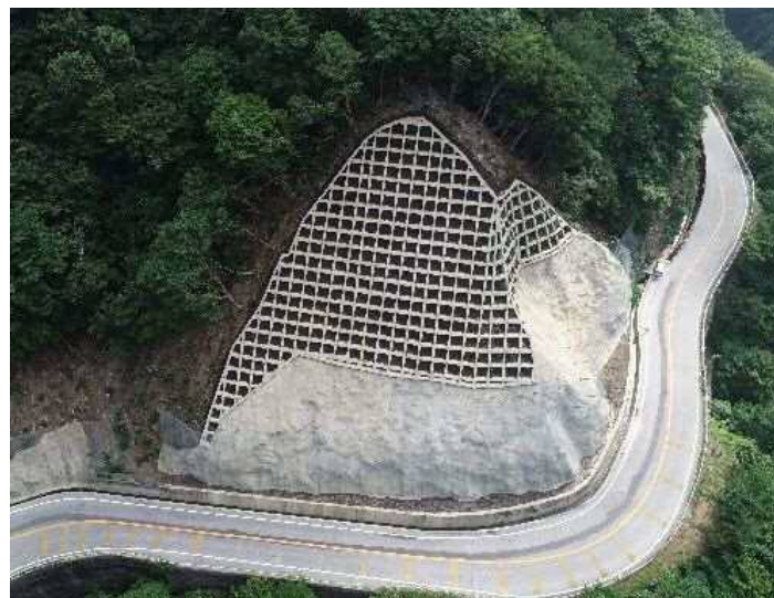
令和元年8月 対策実施