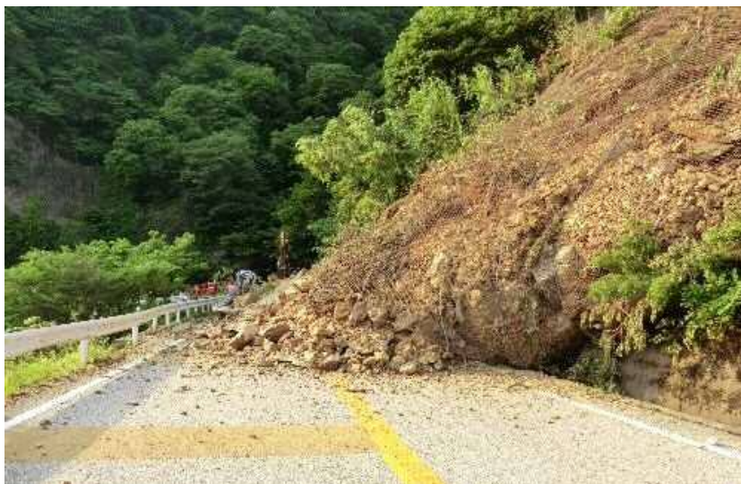
平成28年6月 被災状況