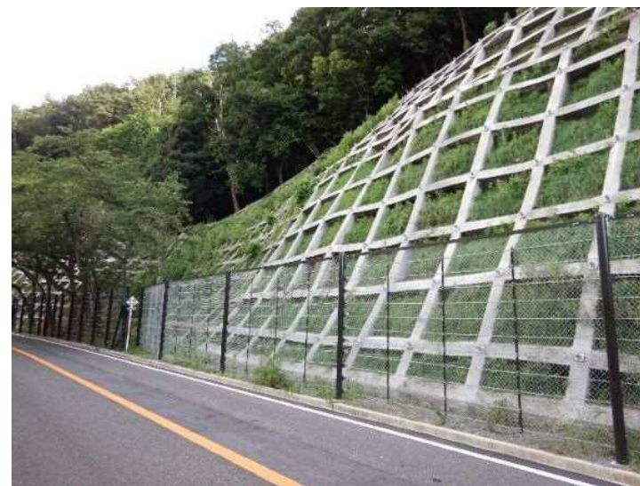
令和元年8月 対策実施