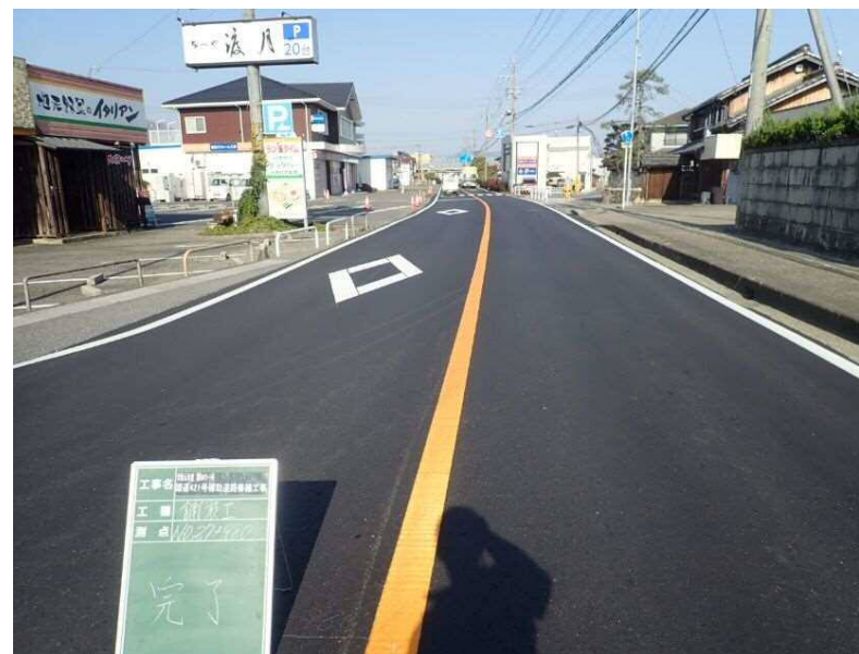
国道421号 東近江市林田町地先