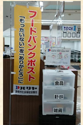
フードバンクポスト

食品ロスの削減と、新型コロナウイルス感染症拡大の影響で食材の確保が難しい方々への支援を目的に、2020年6月から、店舗内に「フードバンクポスト」を設置。食品や日用品の提供を来店客に呼びかけ、集まった食品等を必要とされる方々へ寄付する取組を開始。また、食を通じた居場所づくりを目指す「みんなの食堂」や、医療従事者への弁当無償提供プロジェクト「フードバトン」に対して産直市の持越品を定期的に提供するなど、コロナ禍における課題にタイムリーに対応。様々な取組を地元企業や地域住民を巻き込んで実施している。