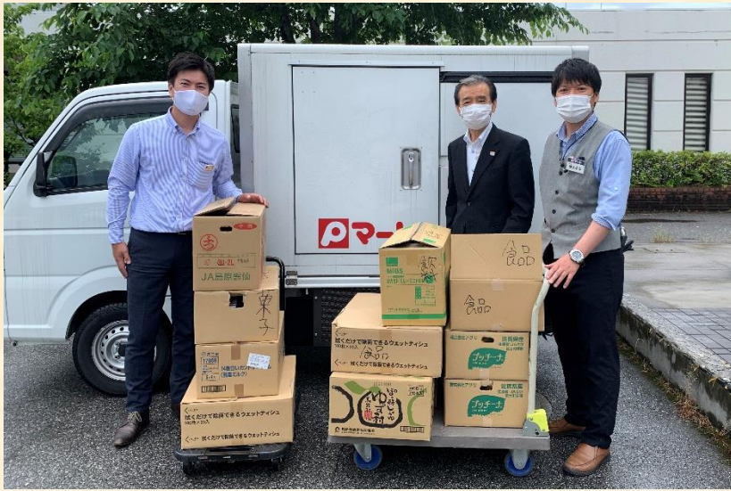
集まった食品等を社会福祉協議会へ寄付