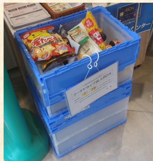
店舗に設置されている収集コンテナ

【ダイエー瀬田店・イオンフードスタイルの取組】 食品ロス削減に積極的に貢献できる企業を目指し、2018年より全国のスーパーに先駆けてフードドライブ（※）を開始。包装が破損した商品等をフードバンク団体へ寄付することで、事業系食品ロスの削減に貢献。また、毎月第3月曜日から翌日曜日までの7日間、店頭で収集コンテナを設置し、地域住民から食品の提供を募ることで、家庭系食品ロスの削減にも貢献している。