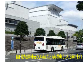
「2040年、道路の景色が変わる」国土交通省より抜粋