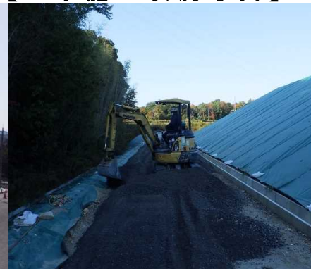
③ キャッピング工 C工区の舗装路盤工を行っています。