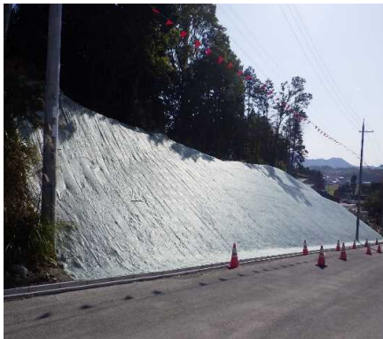
① 工事用進入路 植生シート敷設完了しました。