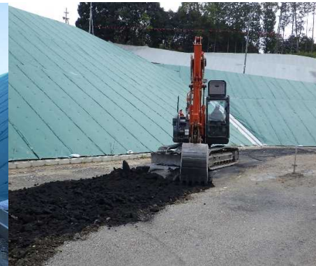
③ キャッピング工 E工区の舗装路床工を行っています。