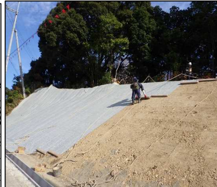
① 工事用進入路 植生シートを敷設しています。