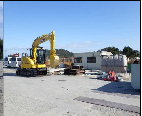
⑤ その他工 旧事務所の解体をしています。