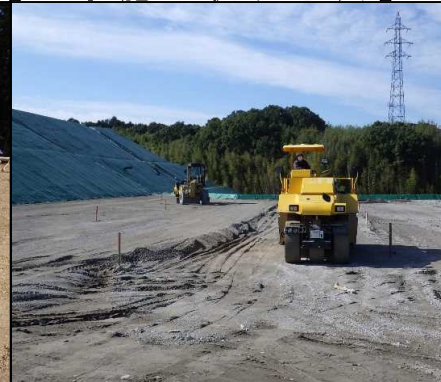
③ キャッピング工 A工区の舗装路盤工を行っています。