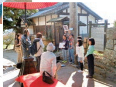
小学生による彦根城ガイド