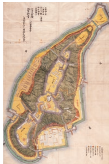
◀ 御城内御絵図(彦根城博物館蔵)

能は儀式のときに上演され、藩主と家臣がともに鑑賞しました。本物の能舞台が城の中に残っているのは、全国で彦根城だけです。