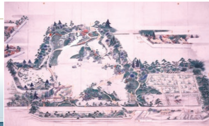
◀ 玄宮園図(彦根城博物館蔵)

江戸時代の絵図のままの景色が残る大名庭園です。美しい景色を楽しむだけでなく、藩主と家臣が和歌、茶の湯、武芸などを実践するところでした。(表紙写真)