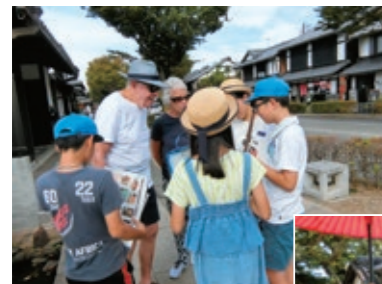
外国人観光客へのインタビュー

総合的な学習の時間を利用して、彦根城や地域の文化に親しむ学習をしています。4年生は、子どもたち自身がガイドになって、彦根城の魅力を観光客に伝えています。6年生は、外国人観光客へのインタビューも行いました。地域の良さを知って、将来は地域を担う存在になってほしいと考えています。(幸校長先生のお話)