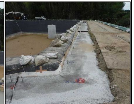
③ キャッピング工 固定工1回目コンクリート打設後状況です。