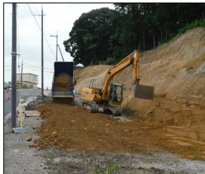
① 工事用道路工 進入路借地部分を復旧盛土しています。