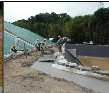
② 洪水調整設備工 固定工のコンクリート打設を行っています。