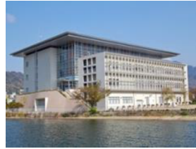
琵琶湖環境科学研究センター

令和2年度からは、第六期中期計画に基づき、「琵琶湖をとりまく環境の保全再生と自然の恵みの活用」「環境リスク低減による安全・安心の確保」「気候変動に適応した豊かさを実感できる持続可能な社会の構築」に向けて試験研究を推進しています。