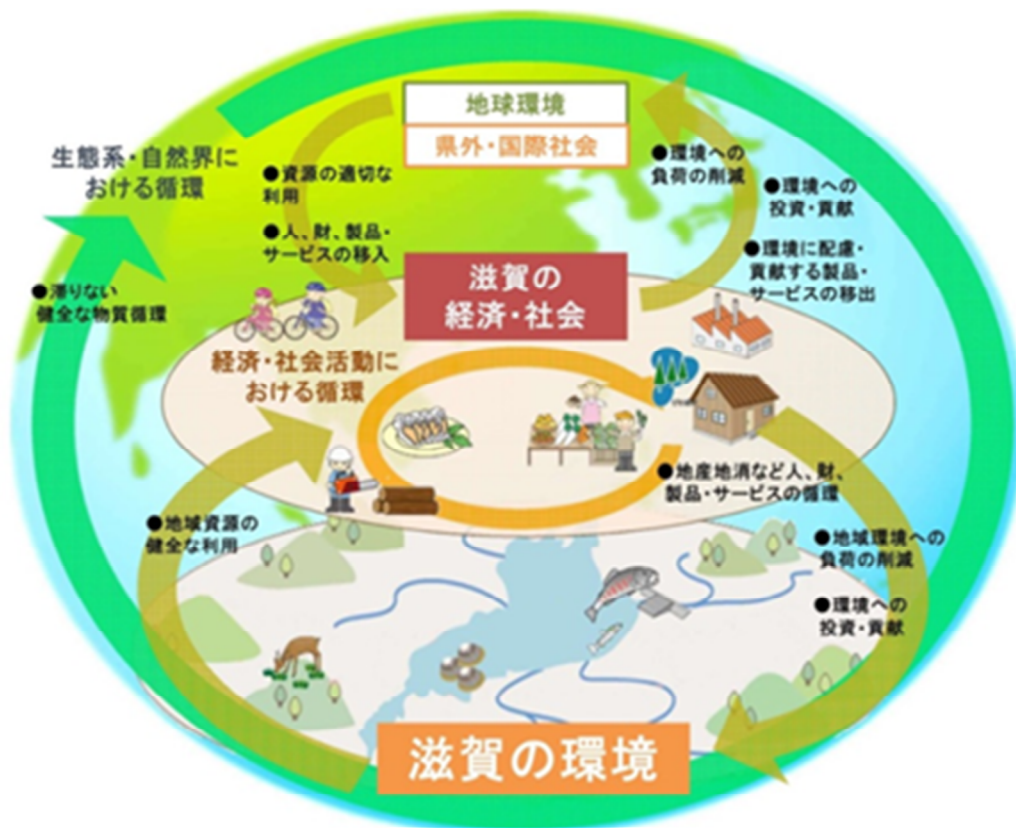
環境と経済・社会活動をつなぐ健全な循環

この「健全な循環」とは、里山や琵琶湖の周辺などにおいて成り立ってきた森林資源や在来魚介類などの地域資源を、地産地消などの取組により、人、財、製品、サービスとして地域内で循環するとともに、異なる地域が、地域資源を介して他の地域と相互に支えあう関係をつくることと考えています。