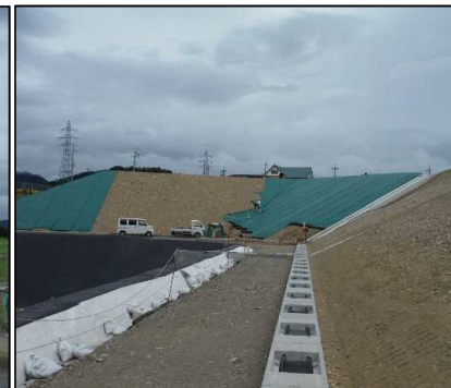
③ キャッピング工 A工区キャッピングシートを設置しています。