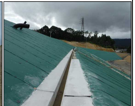
④ 雨水排水工 小段排水張りコンクリート型枠を設置しています。