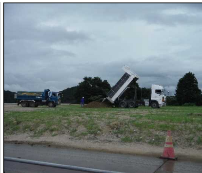
③ キャッピング工 水平部覆土を受け入れています。