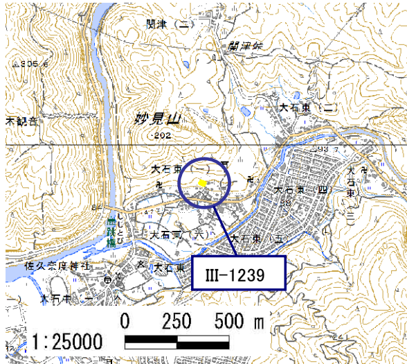
土砂災害警戒区域・土砂災害特別警戒区域 位置図

この地図は、国土地理院長の承認を得て、同院発行の電子地形図 25000を複製したものである。(承認番号 平28情複、第1479号)