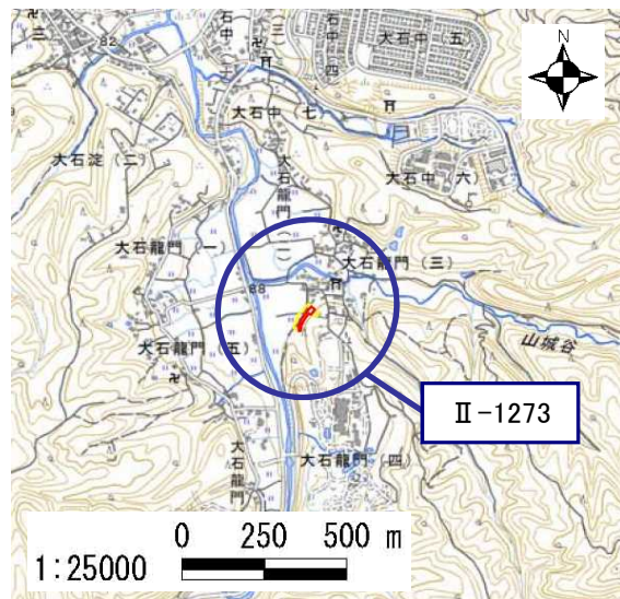
土砂災害警戒区域・土砂災害特別警戒区域 位置図

・この地図は、国土地理院長の承認を得て、同院発行の電子地形図 25000を複製したものである。(承認番号 平28情複、第1231号)