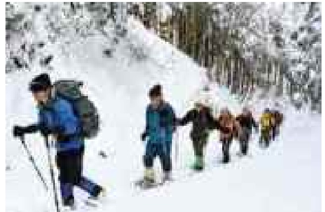
鈴鹿山系の「日本コバ」でのスノーシューハイイク