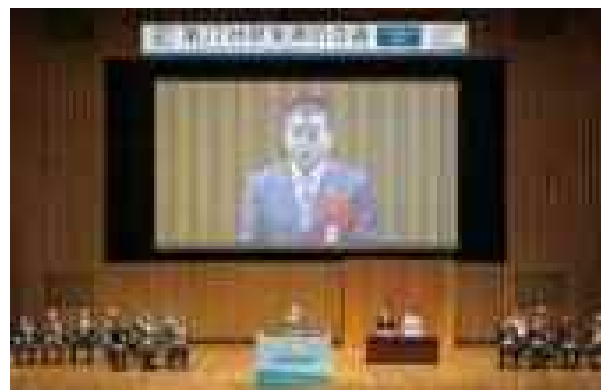
第17回世界湖沼会議(平成30年10月)