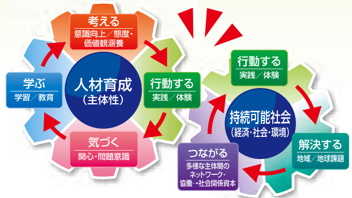
環境学習のギアモデル