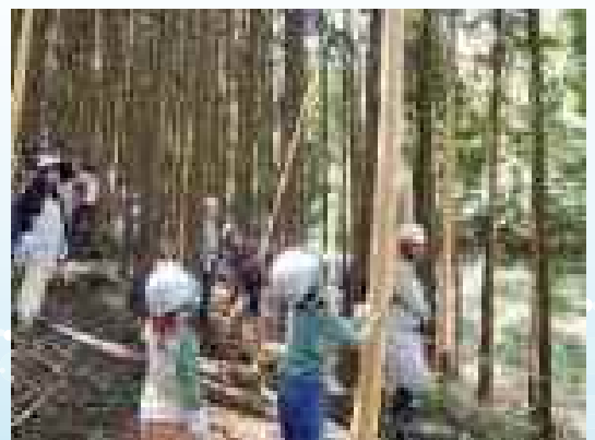
県民の協働による森林づくり