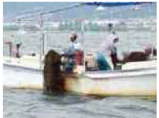
漁船と貝曳き漁具による水草の根こそぎ除去