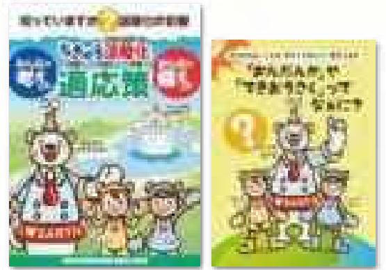
気候変動への適応策を普及するためのパンフレット