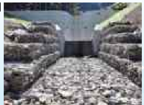
高島市朽木村井における復旧治山事業