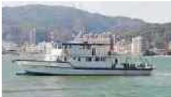
水質調査船「びわかぜ」