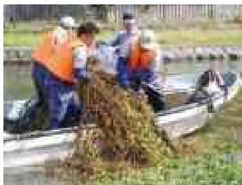
外来水生生物オオバナミズキンバイの除去作業