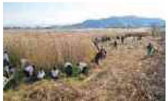
ヨシの刈取り作業