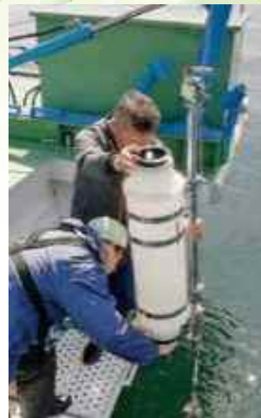
船上での水質調査