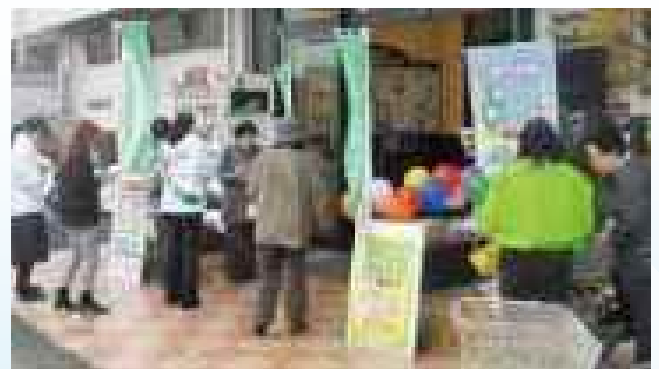
環境に優しい買い物キャンペーン