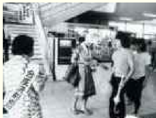
合成洗剤の追放を目指した石けん運動(1970年代)

このような取組に見られるような、多様な主体の協働、パートナーシップによって経済発展と環境保全を両立させた総合的な取組を、滋賀県では「琵琶湖モデル」と呼んでいます。