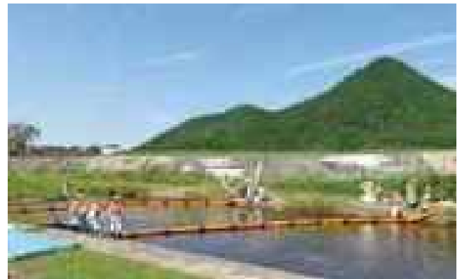
環境団体と行政による水質事故被害拡大防止訓練