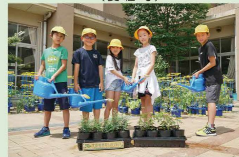
やすしりつ やすしょうがっこう 「野洲市立 野洲小学校」のみなさん