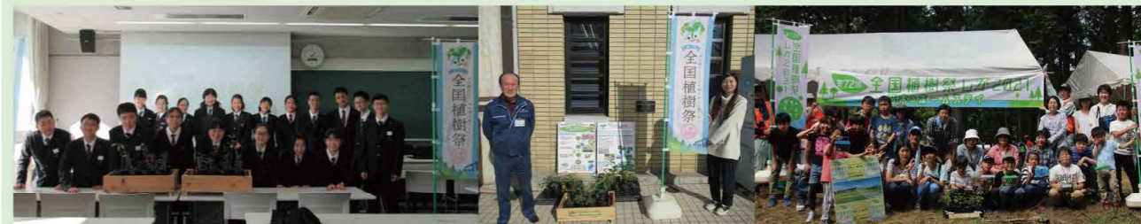
せいふうなんかいこうとうがっこう 「清風南海高等学校」のみなさん (大阪府)

苗木を育て、森に木を植えることは、琵琶湖とその水源となる森林を守ることにつながります。そ こで全国初の県域を越えた取り組みとして、琵琶湖の水で暮らす県外のみなさん(12組)にも、苗木 のホームステイに参加いただいています！