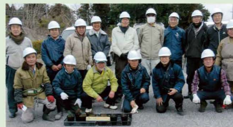
あいしょう まも かい 「愛荘さくらを守る会」のみなさん (愛荘町)

へいせい30ねんからスタートし、げんざい、なえぎ 平成30年からスタートし、現在、苗木のホームステイは204組のご家庭・団体に、苗木のスク ールステイは森林環境学習「やまのこ」の一環として、228校の学校に苗木を育てていただい ています。