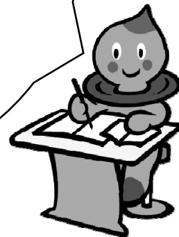
滋賀県の イメージキャラクター うおーたん