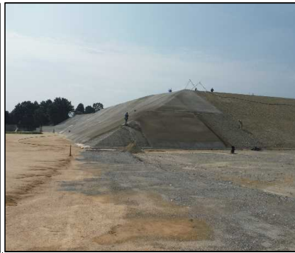
③ キャッピング工 北尾団地側法面のモルタル吹付を行っています。