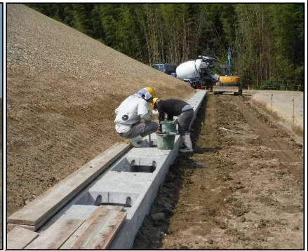
④ 雨水排水工 B工区可変側溝インバートコンクリートを打設しています。