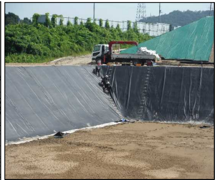
② 洪水調整設備工 調整池のシート張りを行っています。