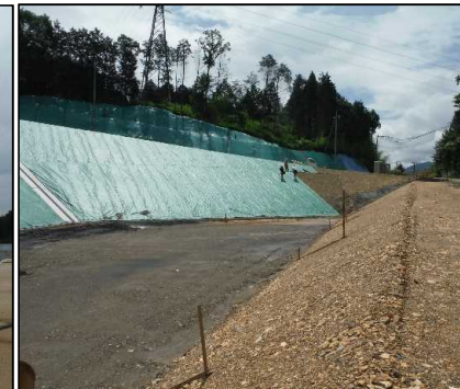
③ キャッピング工 E工区キャッピングシートを設置しています。