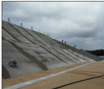
③ キャッピング工 北尾団地側法面モルタル吹付を行っています。