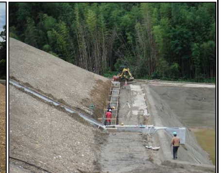
④ 雨水排水工 B工区可変側溝均しコンクリート型枠を設置しています。