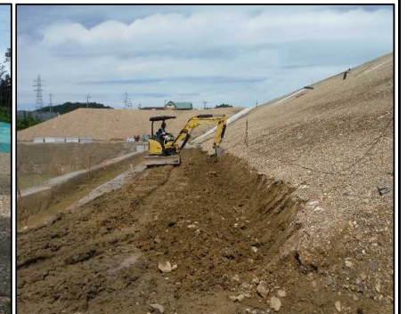
④ 雨水排水工 B工区側溝設置部を掘削しています。