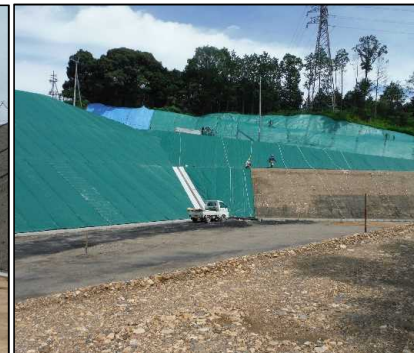
③ キャッピング工 E工区キャッピングシートを設置しています。