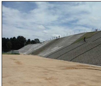
③ キャッピング工 北尾団地側法面モルタル吹付を行っています。