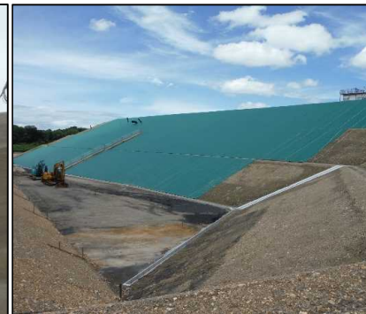
③ キャッピング工 DE工区キャッピングシート設置状況です。