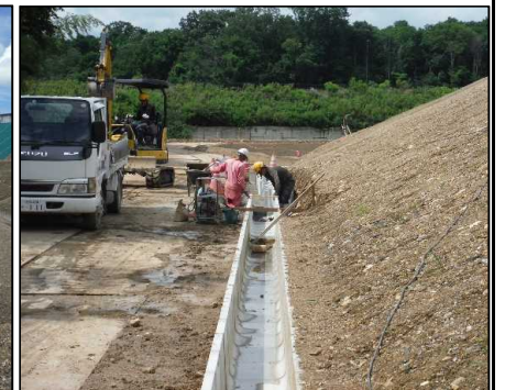
④ 雨水排水工 C工区U字型側溝を設置しています。