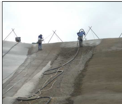
③ キャッピング工 北尾団地側法面モルタル吹付を行っています。