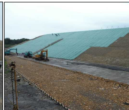
③ キャッピング工 DE工区キャッピングシートの設置状況です。