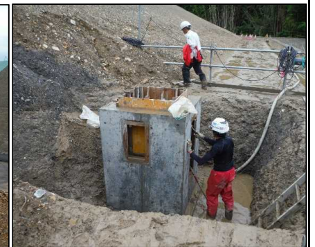
④ 雨水排水工 B工区集水樹の型枠を解体しています。