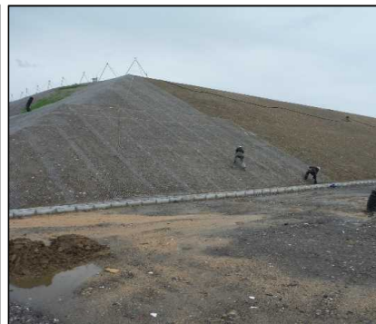
③ キャッピング工 北尾団地側法面ラス網のアンカーピン打設を行っています。