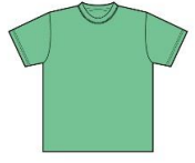
ブライトグリーン