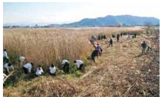
ヨシの刈取り作業