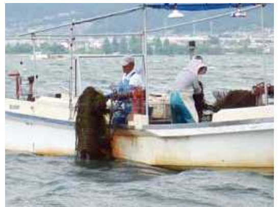
漁船と貝曳き漁具による水草の根こそぎ除去