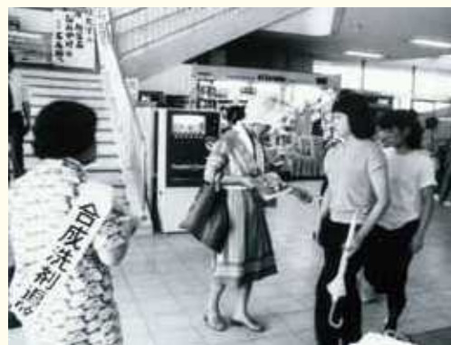
合成洗剤の追放を目指した石けん運動（1970年代）

このような取組に見られるような、多様な主体の協働、パートナーシップによって経済発展と環境保全を両立させた総合的な取組を、滋賀県では「琵琶湖モデル」と呼んでいます。