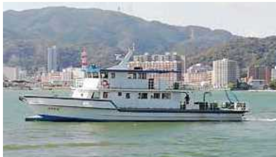
水質調査船「びわかせ」