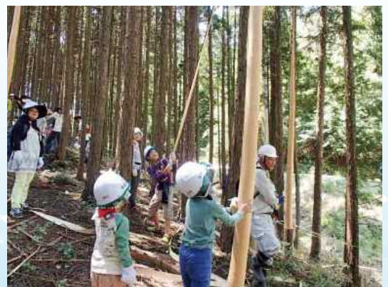
県民の協働による森林づくり