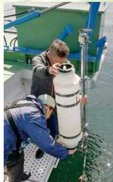
船上での水質調査