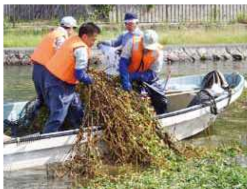
外来水生生物オオバナミズキンバイの除去作業