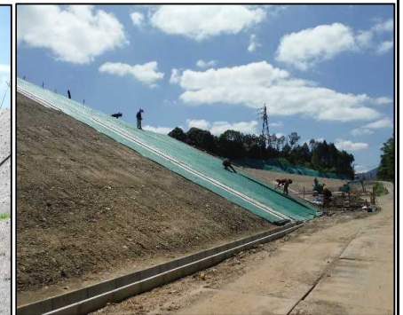
③ キャッピング工 D工区キャッピングシートを設置しています。