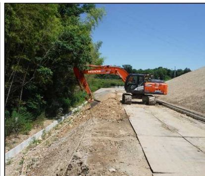
③ キャッピング工 C工区法面覆土整形を行っています。