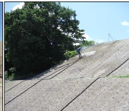
③ キャッピング工 北尾団地側法面モルタル吹付を行っています。