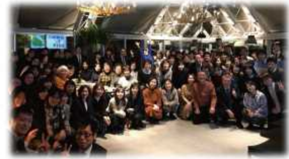
滋賀県ではたらく保健師が大集合！(保健師の集い2019)