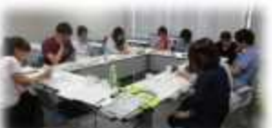
人生の最終段階における医療・ケアの普及・啓発プロジェクト(ACP)会議