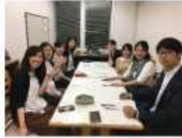
若手保健師勉強会風景

市町、県で働く保健師と一緒に学び合う研修会、お互いの労をねぎらう懇話会等も開催され、コミュニケーションも良好です。