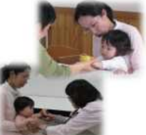
乳幼児健診の様子