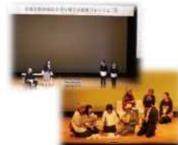
滋賀の医療福祉を守り育てる県民フォーラム