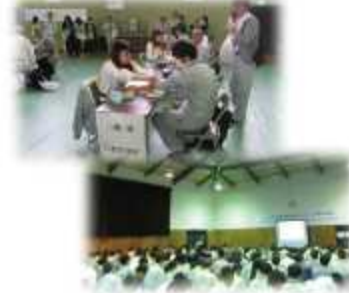
鳥インフルエンザの訓練の様子