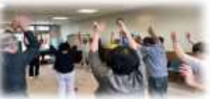
神経難病患者および家族の会「のびのび会」体操の様子