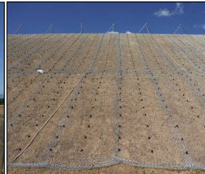
③ キャッピング工 北尾団地側法面ラス網の設置をしています。