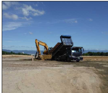
③ キャッピング工 天端覆土の受け入れを行っています。