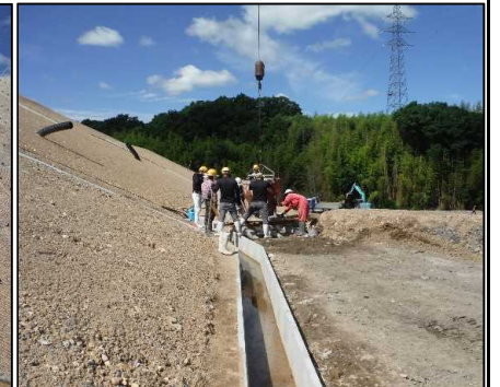
④ 雨水排水工 A工区縦排水の張りコンクリートを打設しています。