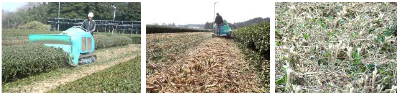
図1 大型ハンマーナイフモアによる台切り更新 左：更新作業状況，中：地上高 10cm での台切り，右：台切りによる茶株の裂傷