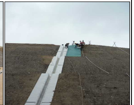
③ キャッピング工 キャッピングシートを設置しています。