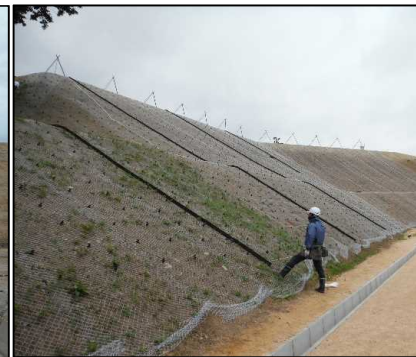
③ キャッピング工 北尾団地側法面ラス網の設置をしています。