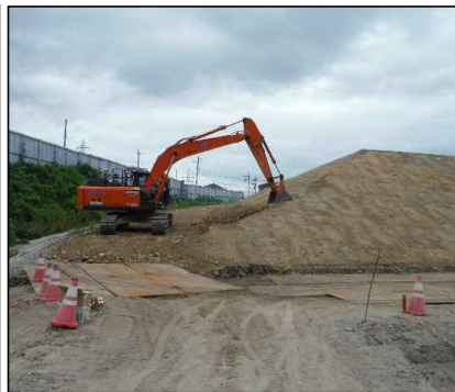
③ キャッピング工 A工区法面覆土を整形しています。