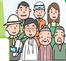
地域学校協働活動による連携体制