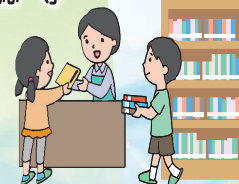
図書館機能の充実