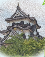
文化財の保存継承人づくり