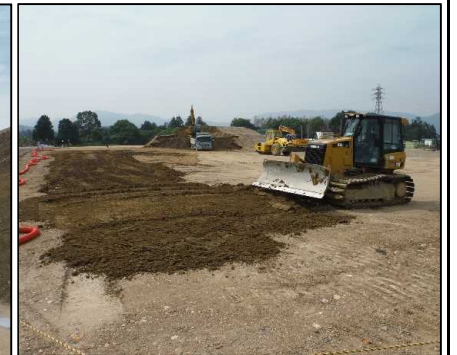
③ キャッピング工 天端覆土を盛土しています。