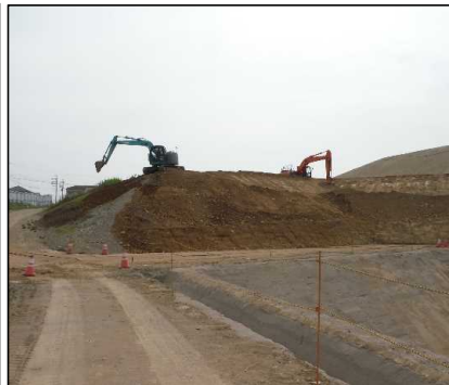
③ キャッピング工 A工区法面覆土を整形しています。