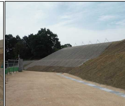
③ キャッピング工 北尾団地側法面ラス網の設置をしています。