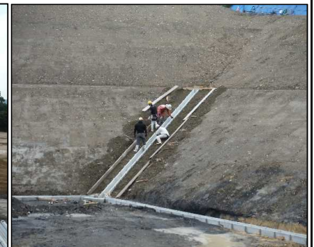
④ 雨水排水工 DE工区縦排水張りコンクリート型枠を設置しています。