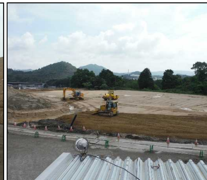
③ キャッピング工 天端覆土を盛土しています。