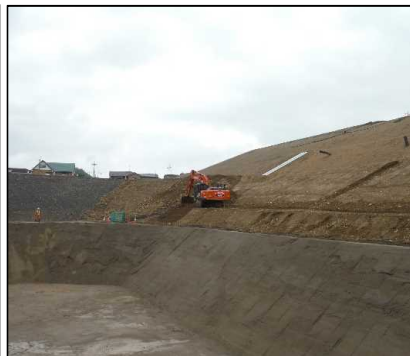
③ キャッピング工 B工区法面覆土整形を行っています。