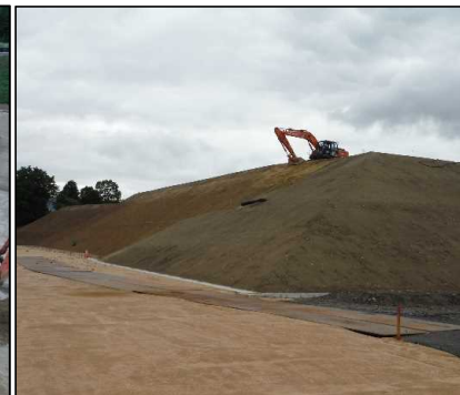
③ キャッピング工 北尾団地側法面堰堤の整形を行っています。