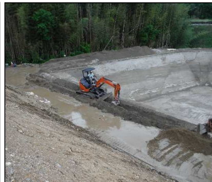
② 洪水調整設備工 セメント改良土工シート固定工掘削を行っています。