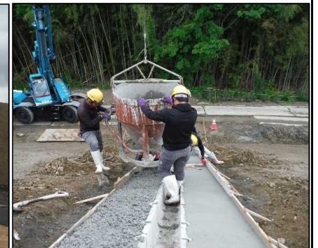
④ 雨水排水工 C工区縦排水張りコンクリートを打設を行っています。