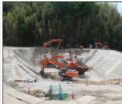
② 洪水調整設備工 セメント改良土工を行っています。