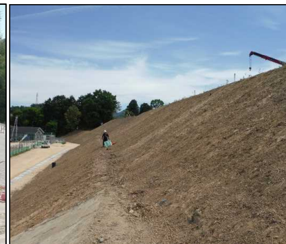
③ キャッピング工 北尾団地側法面除草、防草シート撤去を行っています。