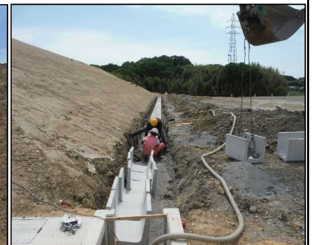
④ 雨水排水工 A工区雨水排水U字側溝据付を行っています。